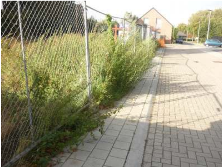
Voetpad Reepstraat overwoekerd , na actie ANDERS is er opgetreden tegen aannemer