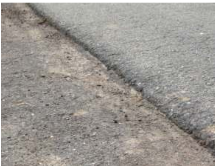
Parallelweg gevaarlijk voor fietsers en auto's . Na actie ANDERS zal het Vlaams gewest herstellingen uitvoeren.