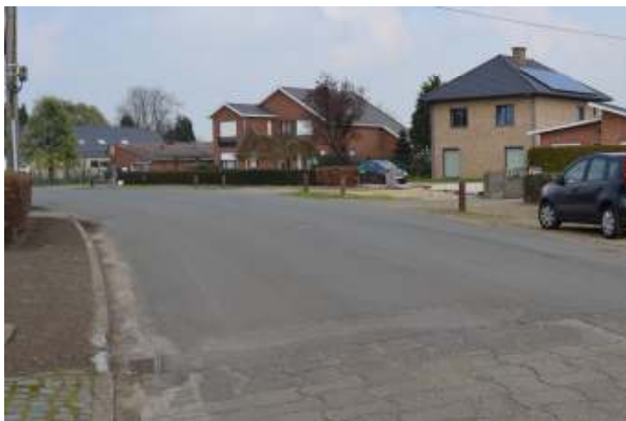
Buurtbewoners vragen witte lijn in midden wegdek, wegens onveiligheid