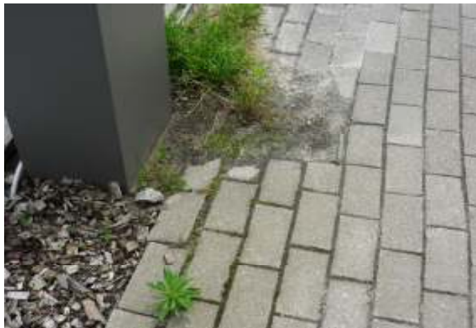
Verzakking voetpad nieuwe Plassenstraat