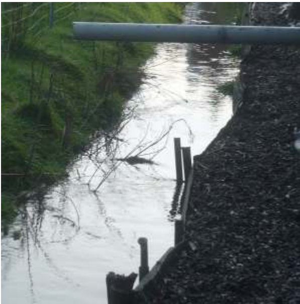
Overlast Gracht Achterhoek