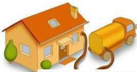
Stookolie - mazout

De stookolieprijzen blijven hoog, wat vooral voor mensen met een lager inkomen voor problemen zorgt. Door een gezamenlijke aankoop kan niet alleen de prijs gedrukt worden, maar krijgen mensen die bv. slechts 500 liter bestellen hun stookolie aan dezelfde prijs als de mensen die 2.000 liter of meer bestellen.