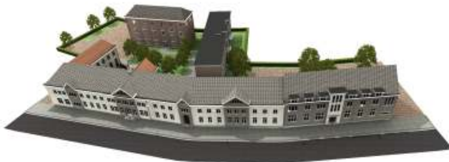
simulatiefoto THV Kloosterhof

De plannen van de tijdelijke handelsvereniging Kloosterhof, tot herbestemming van de voormalige kloostersite in het dorp, hebben groen licht gekregen. Dit houdt in dat de officiële verkoop van de gebouwen binnen een paar weken zal doorgaan en de eerste fase van de afbraakwerken dit najaar kan starten.