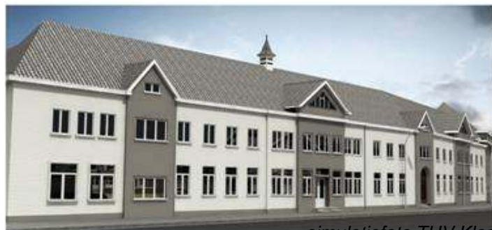
simulatiefoto THV Kloosterhof