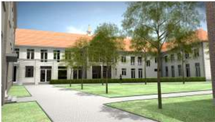
simulatiefoto THV Kloosterhof

De plannen van de tijdelijke handelsvereniging Kloosterhof, tot herbestemming van de voormalige kloostersite in het dorp, hebben groen licht gekregen. Dit houdt in dat de officiële verkoop van de gebouwen binnen een paar weken zal doorgaan en de eerste fase van de afbraakwerken dit najaar kan starten.