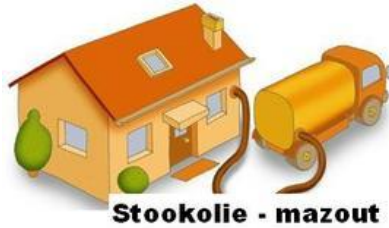
Stookolie - mazout

De stookolieprijzen blijven erg hoog, wat bij veel mensen voor problemen zorgt. Bij aankoop van kleine hoeveelheden betaal je meer per liter dan wanneer je minstens 2.000 liter in één keer aankoopt. Daarom organiseert ANDERS al voor de 12 e maal een gemeenschappelijke aankoop van stookolie, waar iedereen baat bij heeft. Immers: hoe meer liters we samen aankopen hoe goedkoper de prijs per liter is. Of je nu 500 liter aankoopt of 5.000 liter, ieder betaalt dezelfde prijs per liter.