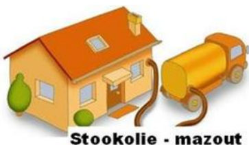
Stookolie - mazout

ANDERS organiseert al voor de 15 e maal een gemeenschappelijke aankoop van stookolie. Iedereen die meedoet heeft daar baat bij want hoe meer liters we samen aankopen hoe goedkoper de prijs per liter is. Bovendien betaalt iedereen dezelfde prijs, of je nu 500 liter aankoopt of 5.000 liter.